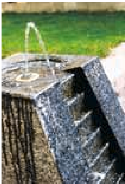
Lyd: Drikkefontenene i Pilestredet Park har fått trappetrinn.