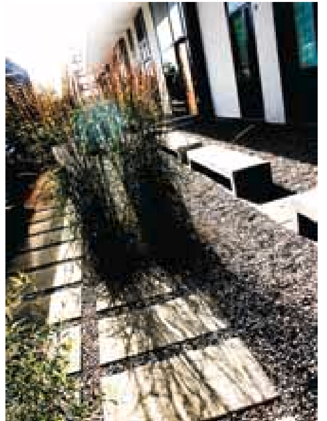
Smart: Elvesingelen bråker når du trår på den, og skal hindre at folk går for nær soveromsvinduene – men velger hellene i stedet.