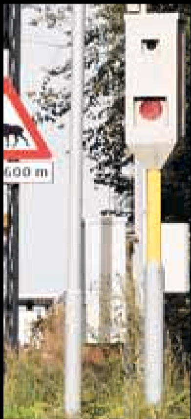
KNIPSET: I denne boksen ble to av de tiltalte fotografert ifølge politiet.