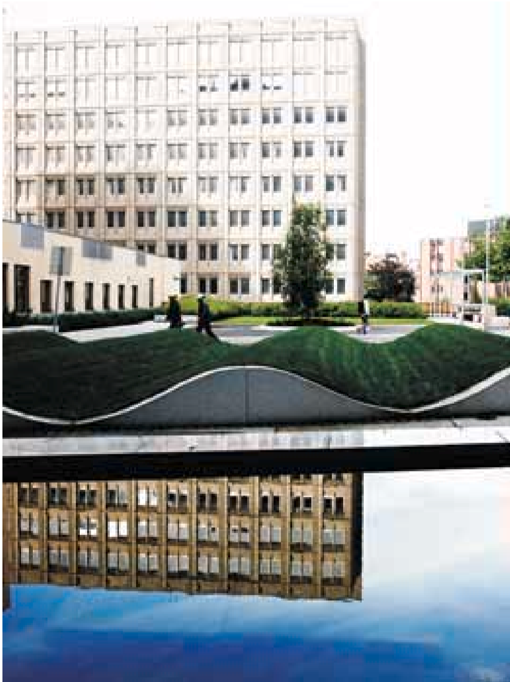
Hvilested: Landskapsarkitektene hos Lindheim & Bjørbeek lagde bølger i gressplenene for å invitere folk til å legge seg ned på i sola. Vannspeilet skaper en egen ro mellom høyblokkene.