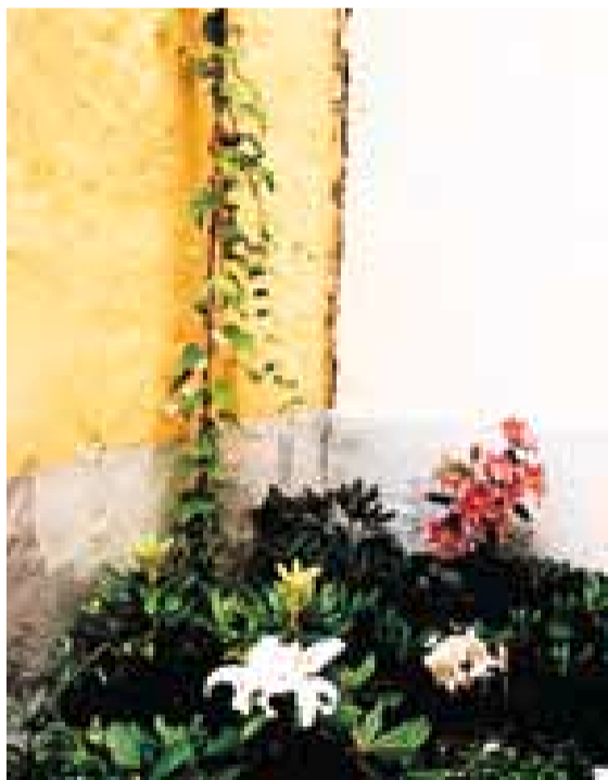
Vakkert: De flotte liljene i blomsterbedet bidrar til den spesielle atmosfæren i gårdsrommet i Vika.