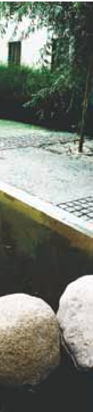
på bakkeplan i Pilestredet kjent med naboene, sier hun.