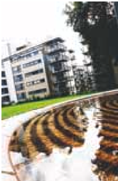
Vannspeil: Fontenebassenget i Pilestredet Park er fra den opprinnelige, hundre år gamle parken på Rikshospitalet.