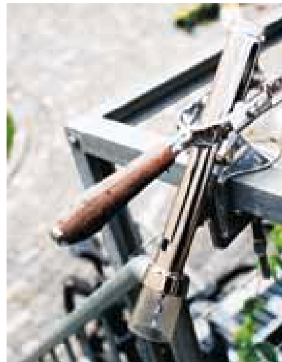
Fastmontert: Sentralvinåpneren i rekkverket på terrassen er et sosialt verktøy i Vika Borettslag.