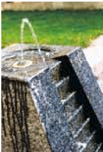
Lyd: Drikkefontenene i Pilestredet Park har fått trappetrinn.