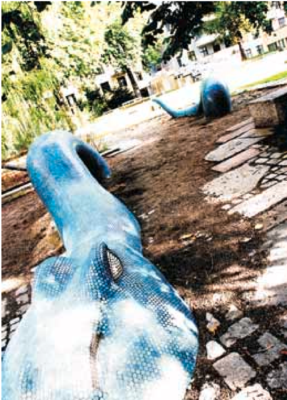
Blåormen: En mystisk orm er skapt for å klatres på, og de hurtigvoksende pilebuskene i bakgrunnen skal forsyne barna med pinnene de trenger til leken i Pilestredet Park.